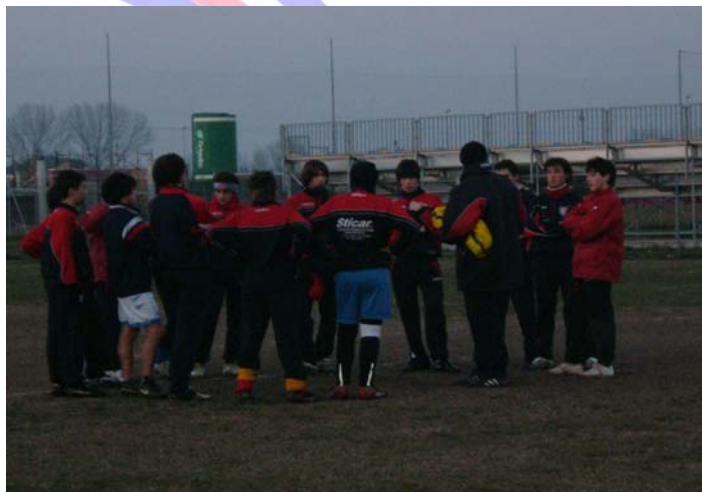
I Giovanissimi durante un loro allenamento

Io personalmente, credo che questa squadra ce la possa fare senza tanti problemi se ciascuno dei ragazzi gioca con impegno e scende in campo con la voglia di far bene e di vincere. Ognuno di loro deve crederci. Se ogni ragazzo crede in quello che fa i risultati arriveranno. Per questo faccio a loro e al mister i miei più sinceri auguri. Forza ragazzi, Bovolone è anche con voi!